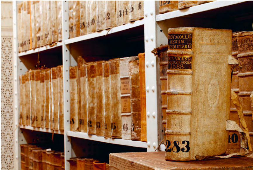
Abb. 11 Reichshofratsprotokolle.

Während die institutionalisierte Geschichtswissenschaft für die Urkundenerschließung des Mittelalters immerhin die Reichsebene bedient hat, hat sie sich um die Erschließung der Aktenbestände der „Zentralbehörden“ des Alten Reiches praktisch nicht gekümmert. Im Übrigen gehört der Umstand, dass überhaupt bereits von den Zeitgenossen so bezeichnete Archive des Alten Reichs existierten und der Großteil der Bestände auch überliefert ist, 135 sogar in der Frühneuzeitforschung eher in den Bereich des Spezialwissens, das offenbar nicht ohne Defekte in die Zeitgeschichte transportiert werden konnte. 136