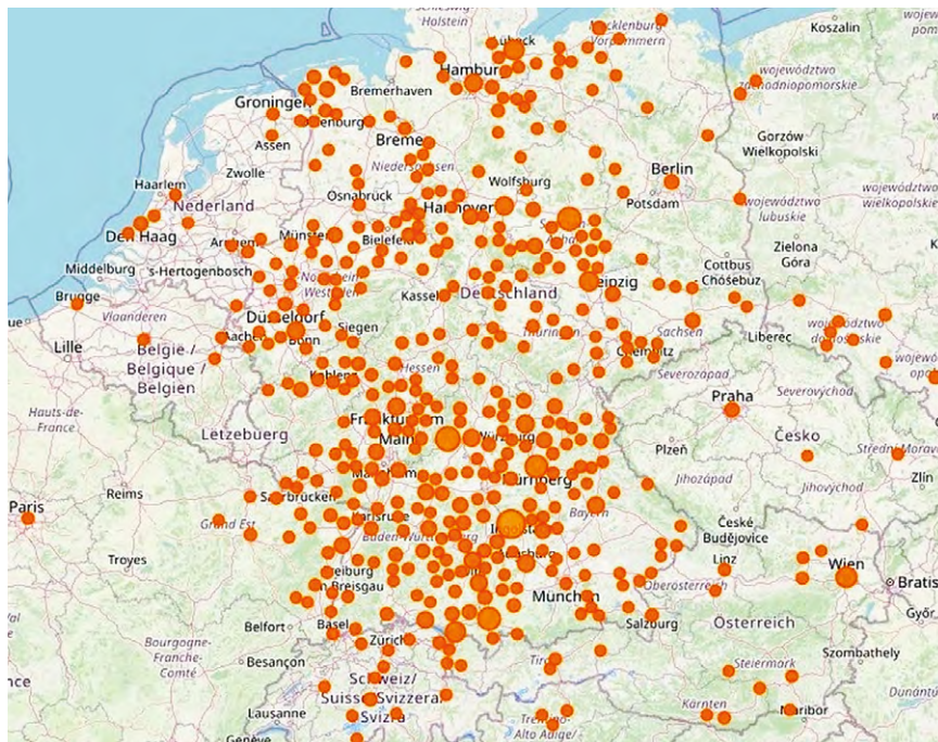
Abb. 10 Karte der Ortswähnungen in den bisher erschlossenen Akten des Kaiserlichen Reichshofrats.