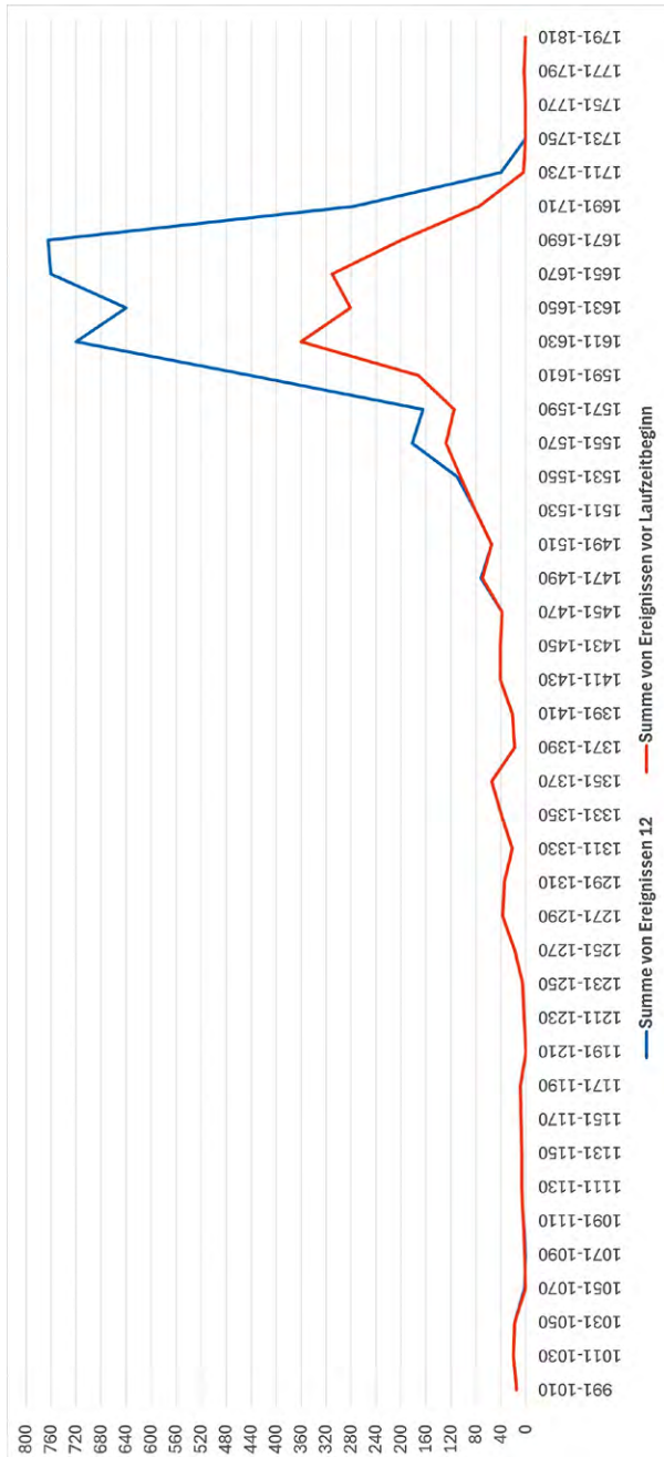
Diagramm 2 Vergleich von Entstehungszeit der Texte (rote Kurve) und vorgangsunabhängigen Aktenstücken ausweislich des „Enthält“-Feldes (blaue Kurve) aus dem dritten Inventarband der Antiqua-Serie im Zeitverlauf.