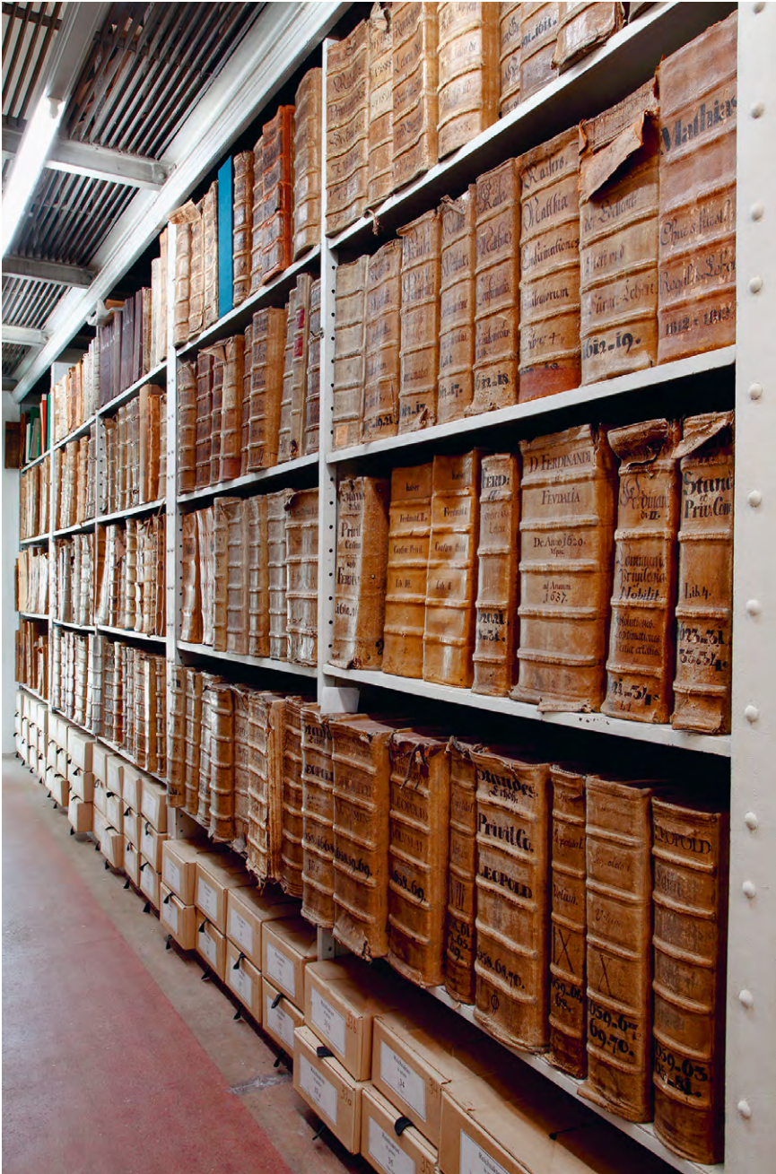
Abb. 13 Reichsregister mit Urkunden- und sonstigen Dokumentenabschriften.