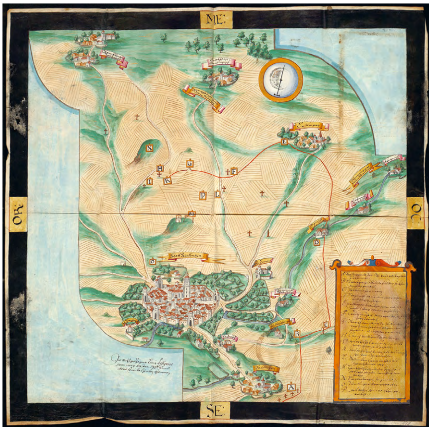
Abb. 3 Karte von Nördlingen und Umgebung (1617); siehe Anm. 49.

um die Wachteljagd. 49 In der betreffenden Reichshofratsakte befindet sich eine von einer kaiserlichen Untersuchungskommission 1617 in Auftrag gegebene detailreiche Karte von Nördlingen und Umgebung, die den Tathergang veranschaulichen sollte (Abb. 3). Darauf zu sehen sind zahlreiche bislang unbekannte Veduten von Orten der Umgebung, insbesondere von Nördlingen. Auch in diesem Fall hat der Vorgang gewiss keinen Einfluss auf die Gestaltung des Kartendetails und somit Informationswert dieses Akteninhalts gehabt.