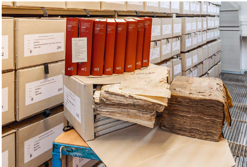
Abb. 9 Die ersten Inventarbände zu den Akten des Kaiserlichen Reichshofrats.

PDF-Dateien der Inventarbände 91 als auch in digitaler Form über das Archivinformationssystem des Österreichischen Staatsarchivs nach dem Open-Access-Prinzip im Netz frei zugänglich. 92