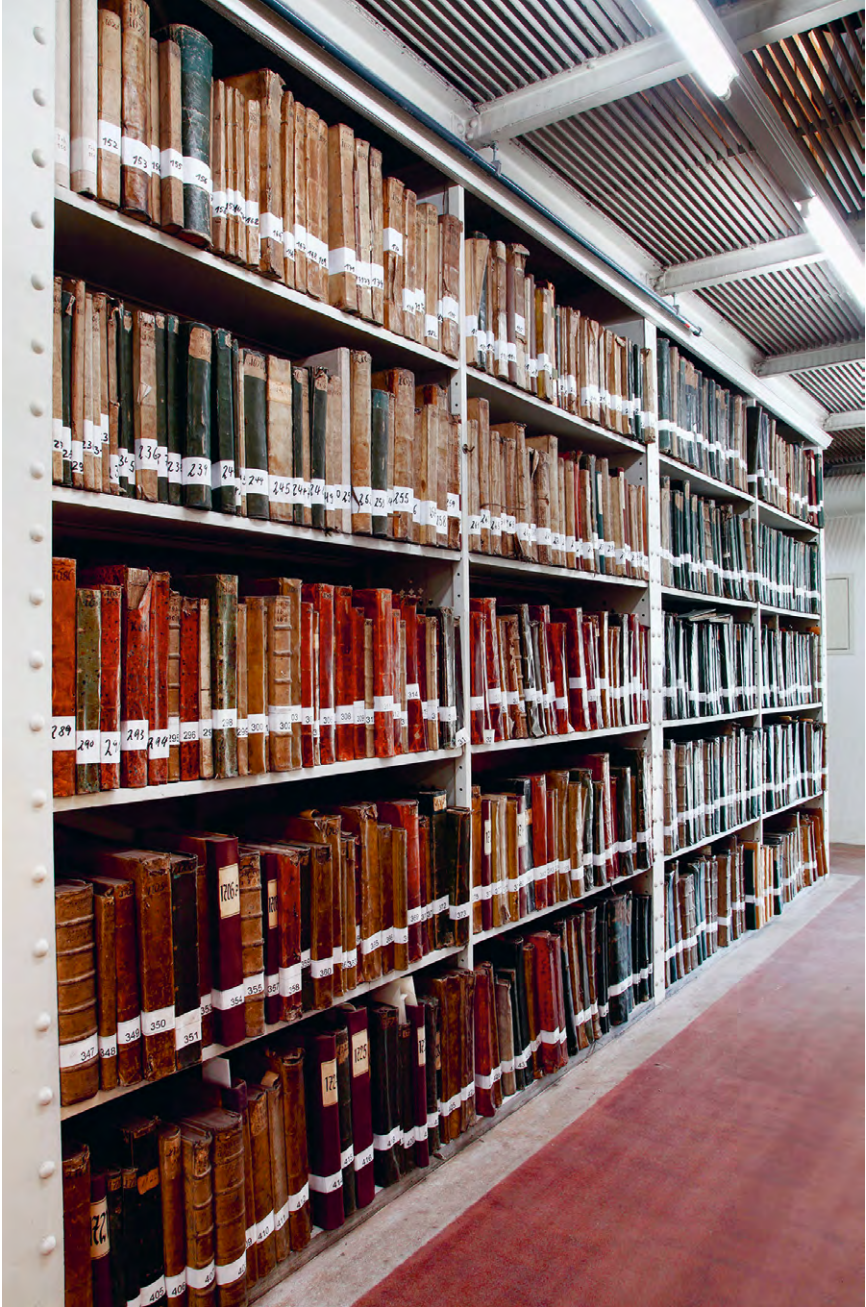
Abb. 12 Taxbücher der Reichskanzlei.