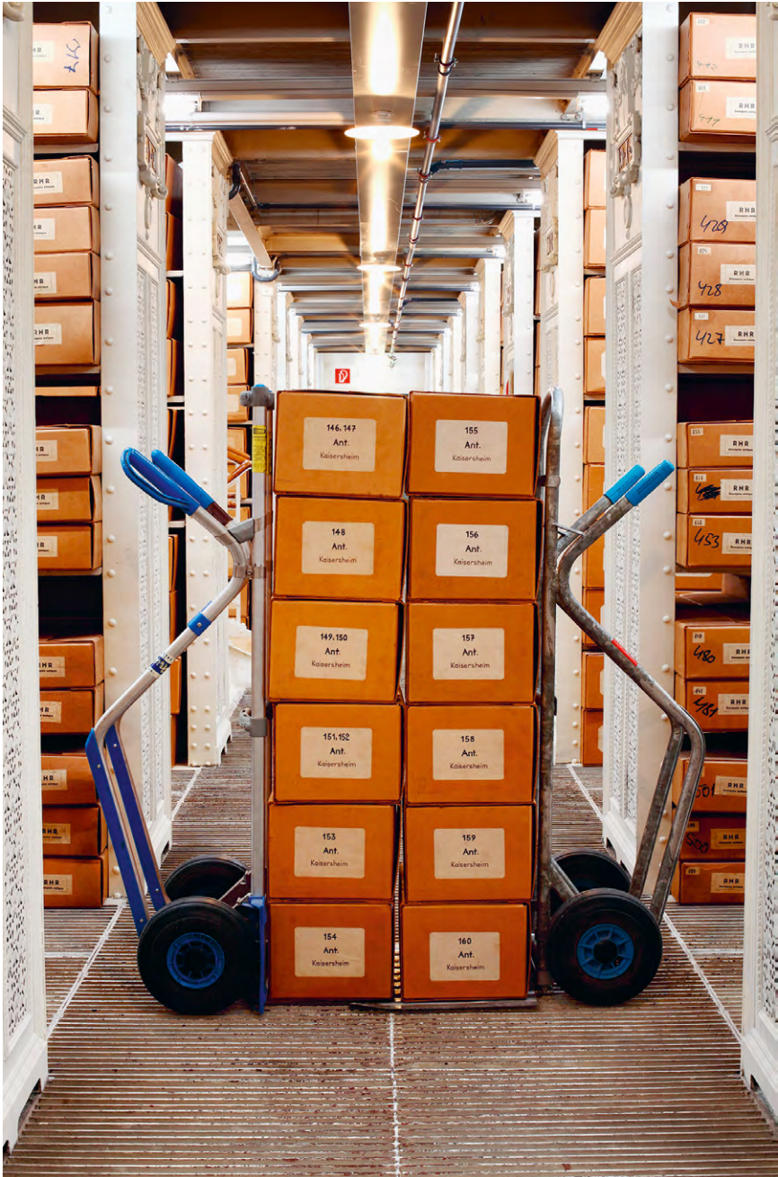
Abb. 1 Prozessakten des Kaiserlichen Reichshofrats zum Streit zwischen dem Kloster Kaisheim und den Herzögen von Pfalz-Neuburg um die klösterliche Reichsunmittelbarkeit; siehe Anm. 47.