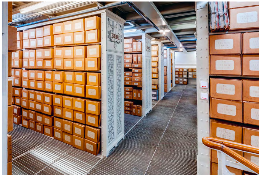
Abb. 8 Magazin im 10. Stock des Haus-, Hof- und Staatsarchivs am Minoritenplatz in Wien.

Gerichte 81 als auch für kollegiale Verwaltungsformen in den Reichsterritorien 82 gelten. Sein archivalisches Erbe befindet sich im Österreichischen Staatsarchiv, Abteilung Haus-, Hof- und Staatsarchiv (Abb. 7). Es erstreckt sich auf ca. 1,3 Regalkilometern und besteht aus rund 100.000 Akten sowie ca. 900 Amtsbüchern (Protokollen) (Abb. 8 und 11). Es verkörpert nicht nur den umfangreichsten Teil der im Wiener Haus-, Hof- und Staatsarchiv vorhandenen reichsarchivischen Bestände, sondern auch den größten zusammenhängenden Aktenbestand, den das Alte Reich überhaupt hinterlassen hat. 83