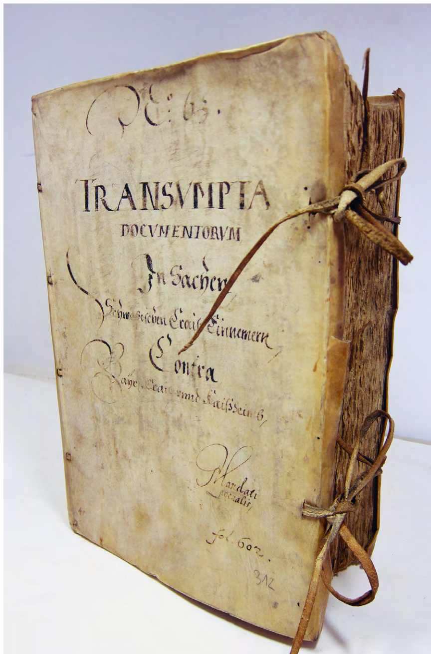
Abb. 2 Abschriften von Kaisheimer Urkunden („Kaisheimer Urkundenbuch“) in den Prozessakten zu Abb. 1; siehe Anm. 48.