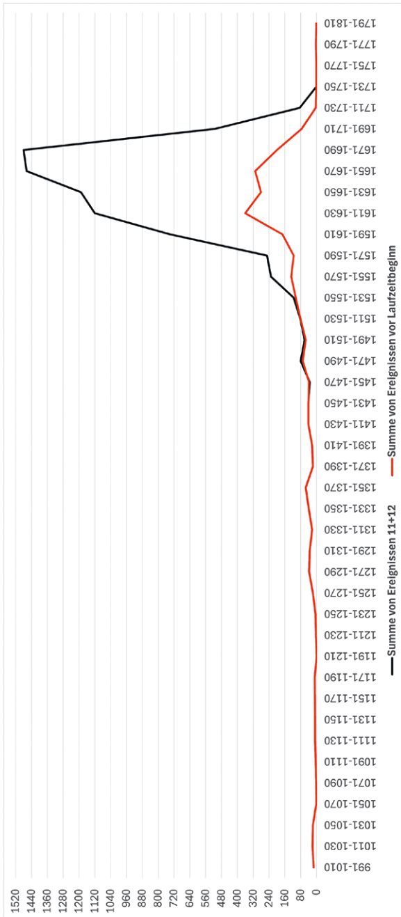
Diagramm 1 Vergleich von Anfertigung der datierten Aktenstücke (schwarze Kurve) und Entstehungszeit der Texte (rote Kurve) aus dem dritten Inventarband der Antiqua-Serie im Zeitverlauf.