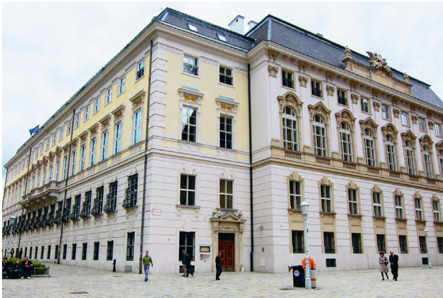
Abb. 7 Das Haus-, Hof- und Staatsarchiv am Minoritenplatz im I. Wiener Bezirk, errichtet 1899–1902.

spiel. 77 Einzelne Funktionseinheiten in diesem Handlungs- und Entscheidungssystem sind besser erforscht als sein Gesamtgefüge, in das unbedingt auch seine höfischen Bezüge, Parteien, Gesandte, Advokaten und Sollizitatoren einzubeziehen sind. 78 Der Reichshofrat jedenfalls bildete ein für die kaiserliche Rechtsprechung, aber auch für die Verwaltung der Reichslehen sowie für Teile der Privilegien- und Gratialsachen zuständiges Justizkollegium. 79 Formiert seit etwa der Mitte des 16. Jahrhundert aus den Hofräten Karls V. und Ferdinands I., 80 kann er sowohl als eine Art Prototyp für frühneuzeitliche herrschernahe